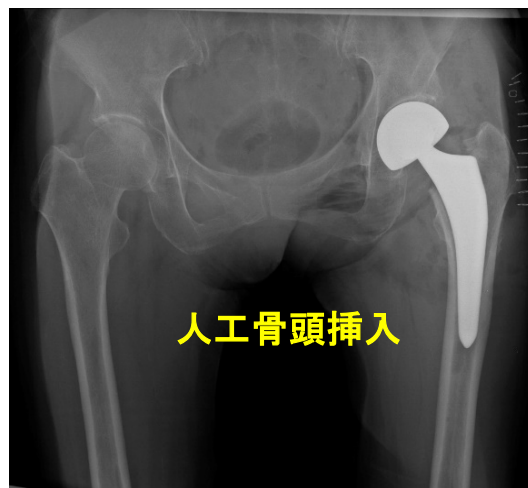
症例 1: 87歳、女性。階段で転倒し受傷